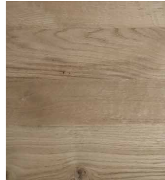
Eichenfurnier Altholz Stärke: 0,9 mm | 1,5 mm Längen: 250-450 cm