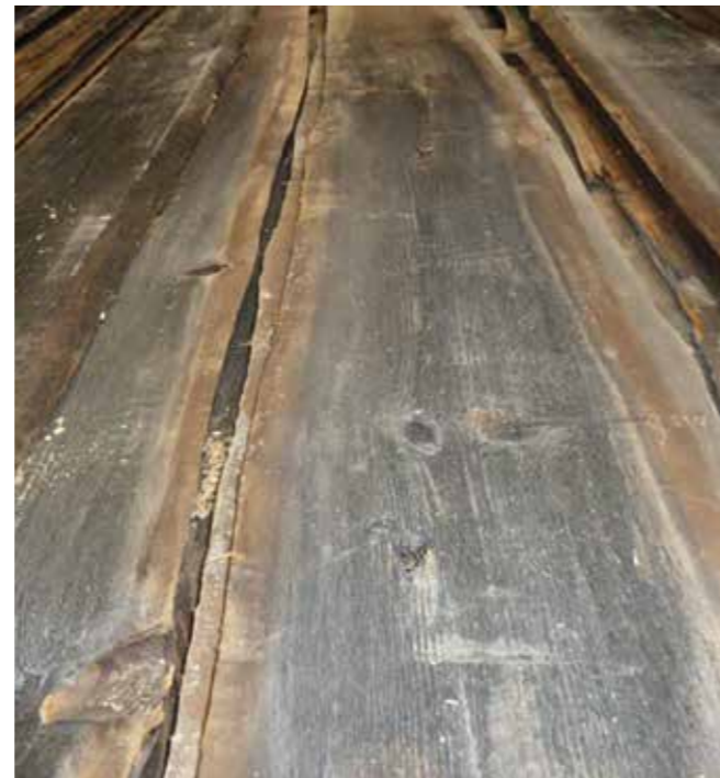
Altholz sonnenverbrannt AD Stärke: 18-23 mm original unbesäumt, nicht behandelt