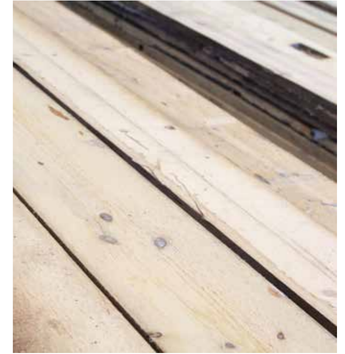
Altholz Fichte/Tanne gedämpft KD Stärke: 30 mm | 40 mm | 50 mm | 60 mm | 80 mm Die Mittelware der alten Balken