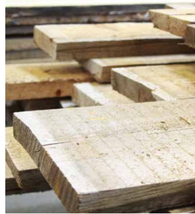
Altholz Fichte/Tanne Natur KD Stärke: 30 mm | 40 mm | 50 mm | 60 mm | 80 mm Die Mittelware der alten Balken