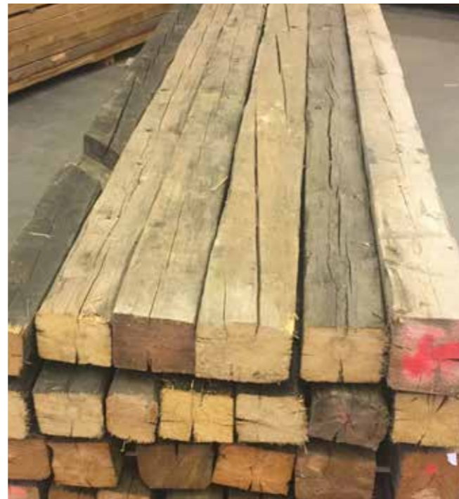
Original Kantholz Fichte Stärke: 10/12 x 14/16 oder 16/18 x 20/22 mm oder 20/24 mm + handgehackt, ungebürstet