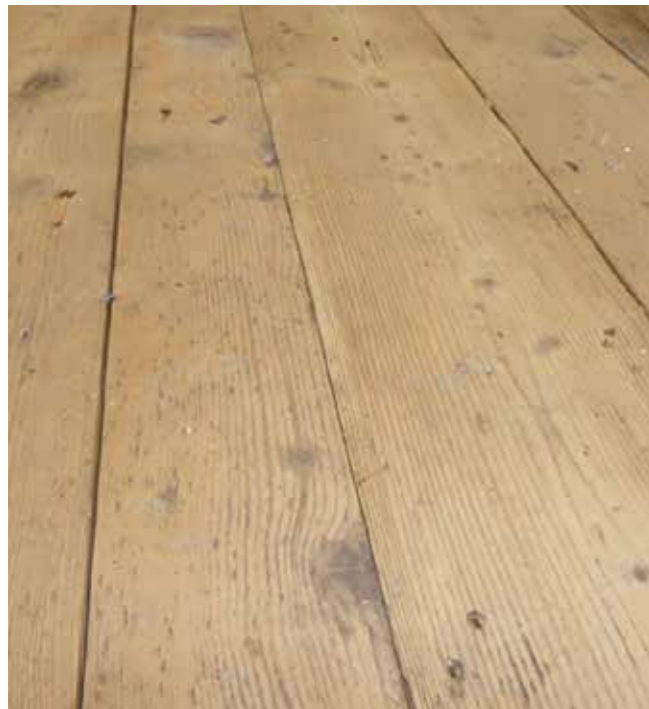
Altholzböden Fichte Stärke: ca. 25 mm besäumt, gebürstet