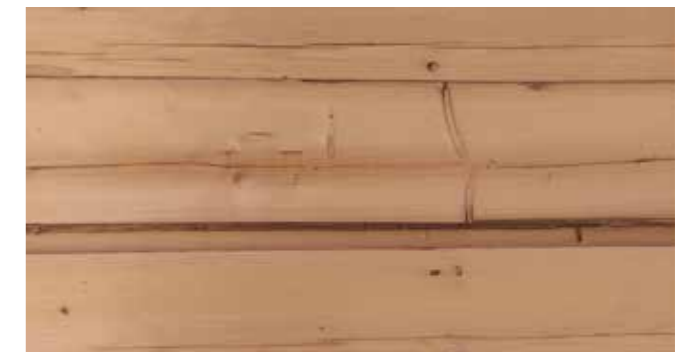
Altholzfurnier Fichte Stärke: 1,5 mm Längen: 250-525 cm