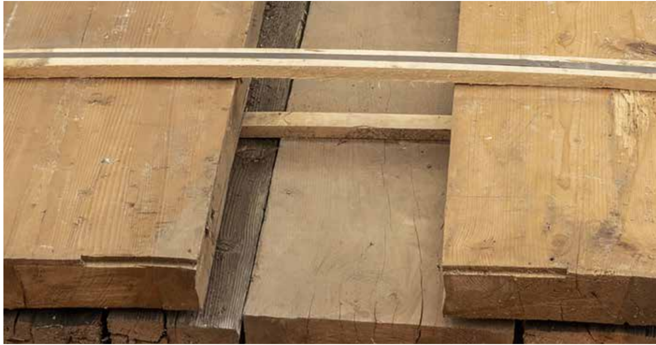
Altholzböden Fichte Stärke: ab 36 mm Unbearbeitet und nicht gesäubert