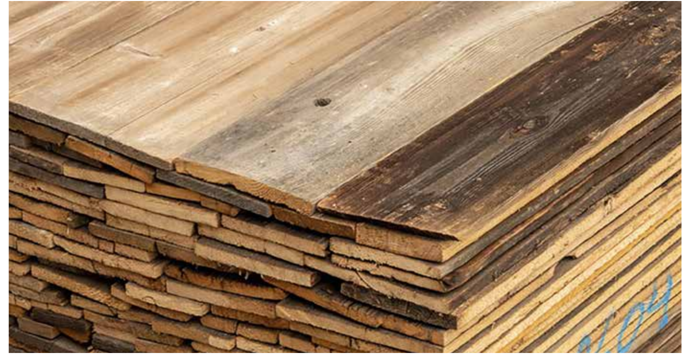
Altholz sonnenverbrannt KD Stärke: 18-23 mm gehobelt, besäumt, gebürstet