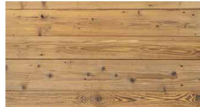
Altholz sonnenverbrannt KD braun Stärke: ca. 20 mm besäumt, gebürstet, gehobelt, Nut & Feder - braun sortiert