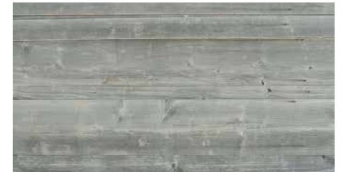
Altholz sonnenverbrannt KD grau Stärke: ca. 20 mm besäumt, gebürstet, gehobelt, Nut & Feder - grau sortiert