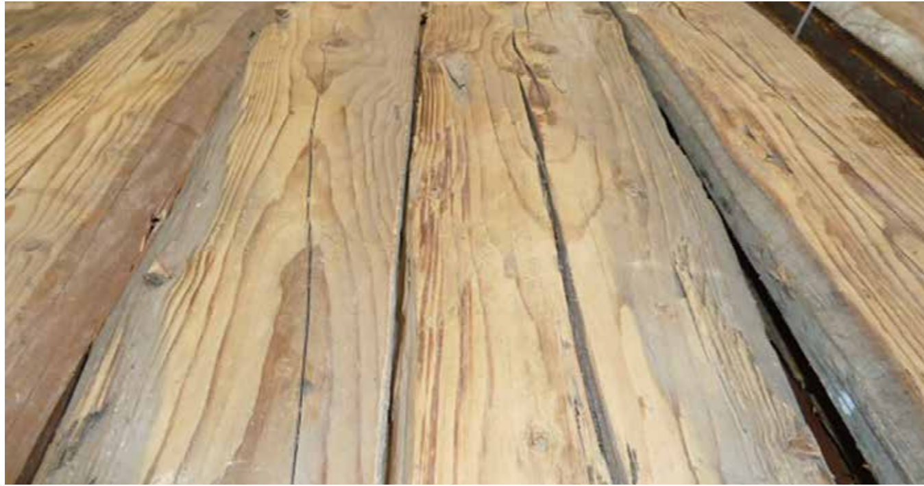
Original gehackte Seiten Fichte AD Stärke: ca. 25-35 mm Seitenschnitte der Tram, handgehackt, unbehandelt