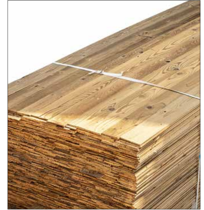
Altholz Fichte/Tanne Lamellen sonnenverbrannt braun Stärke: ca. 6 mm Längen: 100-350 cm | Breite: 80 mm + trocken, besäumt, gebürstet