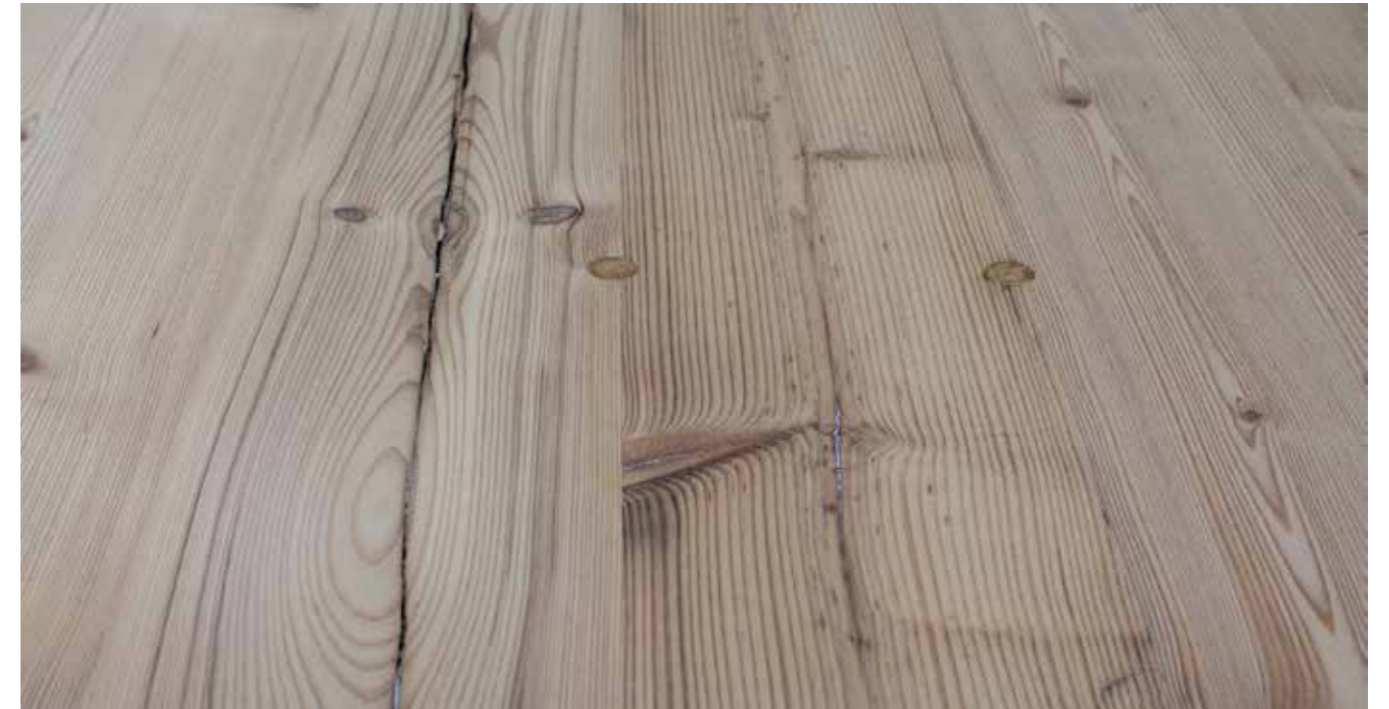
Altholz Fichte/Tanne gedämpft Stärke: 12 mm | 19 mm Decklagenstärke: 5,5 mm Längen: 405 cm | 505 cm Breite: 205 cm Produziert aus Mittelware