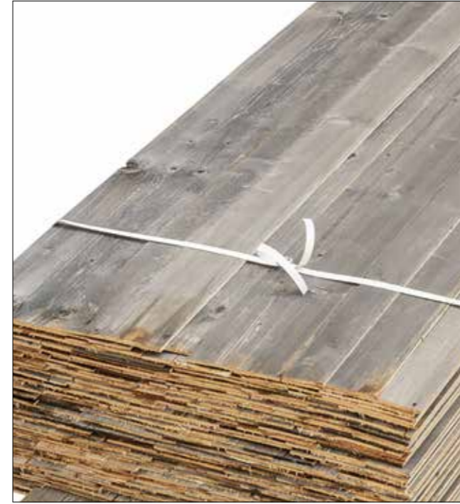
Altholz Fichte/Tanne Lamellen sonnenverbrannt grau Stärke: ca. 6 mm Längen: 100-350 cm | Breite: 80 mm + trocken, besäumt, gebürstet