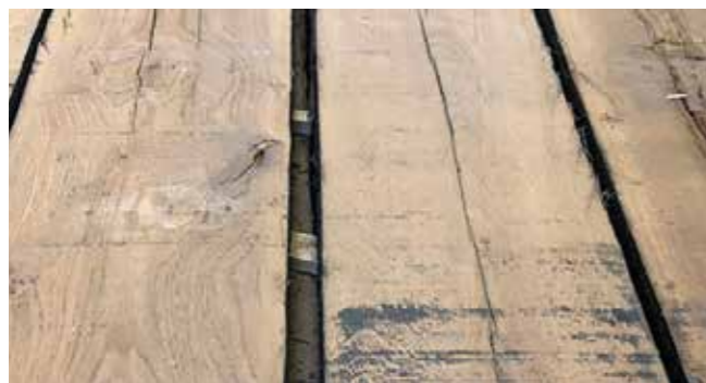
Schnittholz Altholz Eiche gedämpft KD Stärke: 50 mm Messerreste, aus der Furnier Produktion