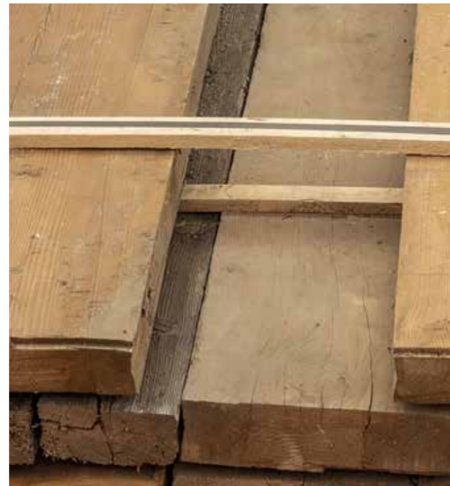
Stadlboden AD Fichte/Tanne Stärke: 40-60 mm Klasse B, geschliffene Oberfläche