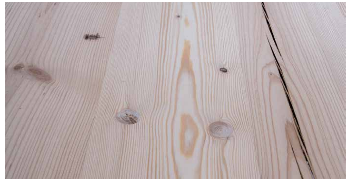
Altholz Fichte/Tanne Natur Stärke: 19 mm Länge: 505 cm Breite: 205 cm Produziert aus Mittelware