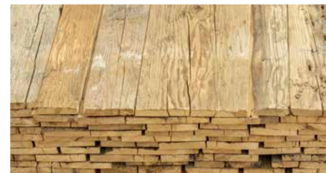
Original handgehackte, gebürstete Seiten Fichte Stärke: ca. 30-40 mm gehobelt, gebürstet, besäumt