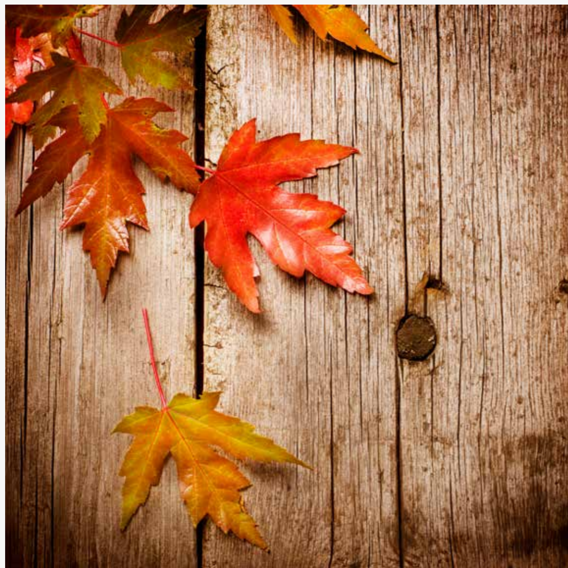
Dies ist ein Auszug aus unserem Altholzprogramm! Weitere Altholzprodukte wie Türen, Pressbäume, etc. auf Anfrage!