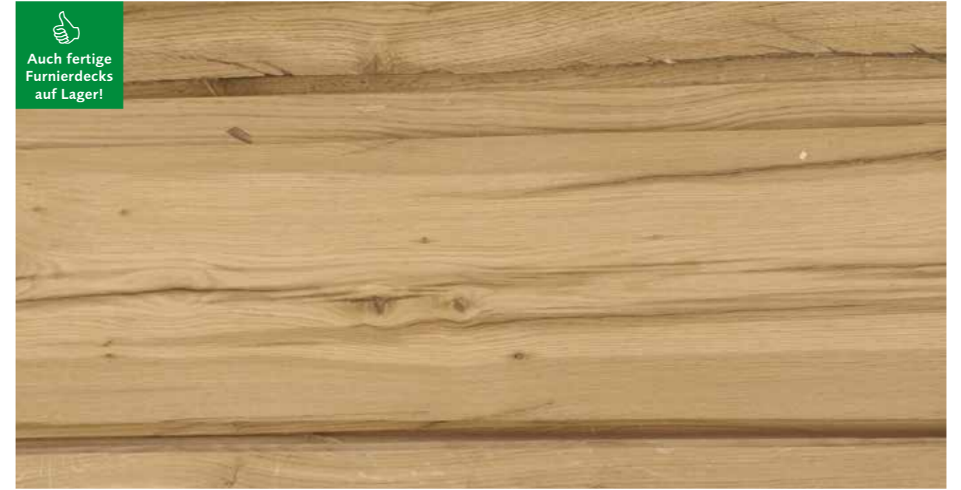
Eichenfurnier/Balkeneiche Stärke: 0,9 mm Längen: 250-450 cm