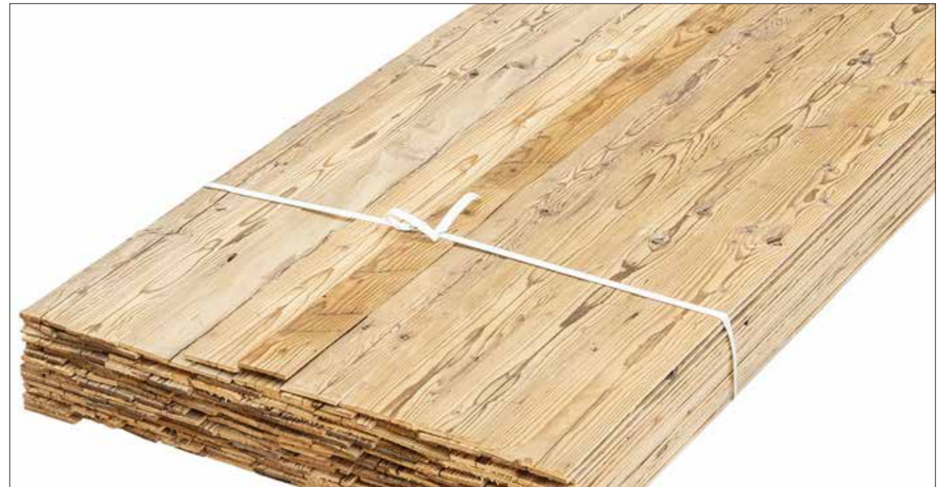
Fichte/Tanne Lamellen gehackt Stärke: ca. 9 mm Längen: 100-350 cm | Breite: 80 mm + trocken, besäumt, gebürstet, Rückseite: kalibriert