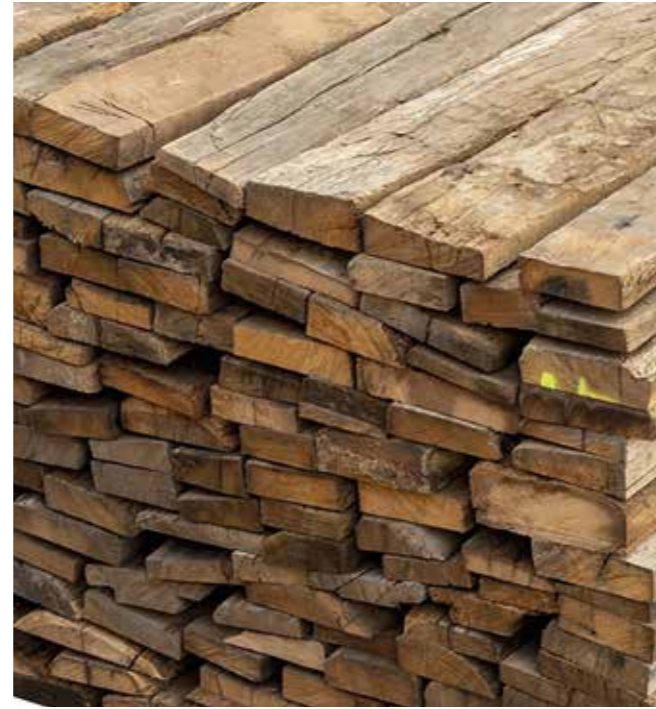
Schnittholz Altholz Eiche Natur KD Stärke: 30 mm | 40 mm | 50 mm | 65 mm | 80 mm Geschnitten als alten Tram, Mittelware