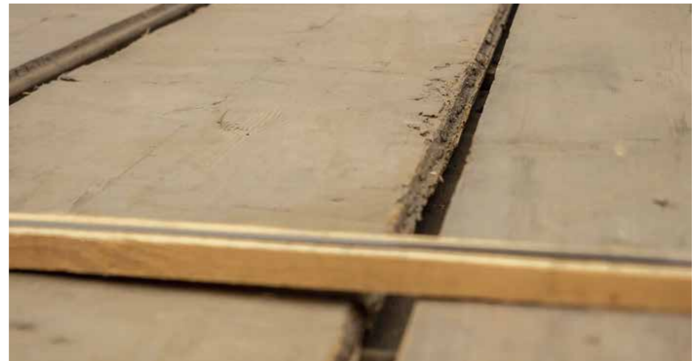
Altholzböden Fichte Stärke: bis 35 mm Unbearbeitet und nicht gesäubert